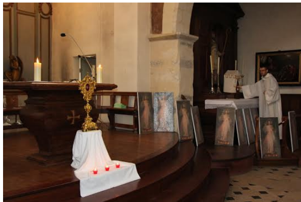
La mission a commencé...

Rouen, Caen, Nantes, Rennes, Tours, la Vendée, Limoges, Toulouse, Montauban, Brive-la-Gaillarde, l'Alsace, Aix-en-Provence, le Lavandou, Annecy, la Seine-et-Marne, Vence, et la Suisse (Fribourg et sa région)